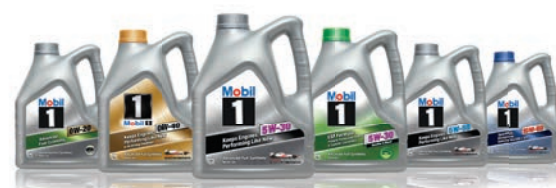
Ассортиментный ряд Mobil 1