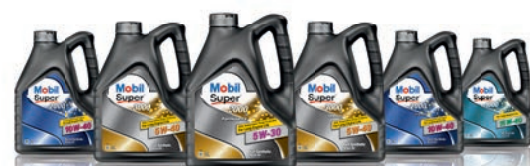
Ассортиментный ряд Mobil Super