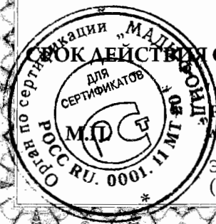
схема сертификации 1с, срок службы и условия хранения продукции согласно документации изготовителя

Срок действия с 20.10.2014 по 19.10.2017 ВКЛЮЧИТЕЛЬНО