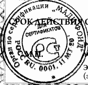
схема сертификации 1с (Действие сертификата распространяется на продукцию, указанную в нем, независимо от страны происхождения.), срок службы и условия хранения продукции согласно документации изготовителя