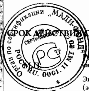
схема сертификации 1с, срок службы и условия хранения продукции согласно документации изготовителя