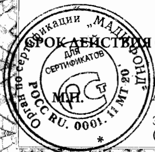
схема сертификации 1с, срок службы и условия хранения продукции согласно документации изготовителя

Срок действия с 20.10.2014 по 19.10.2017 включительно